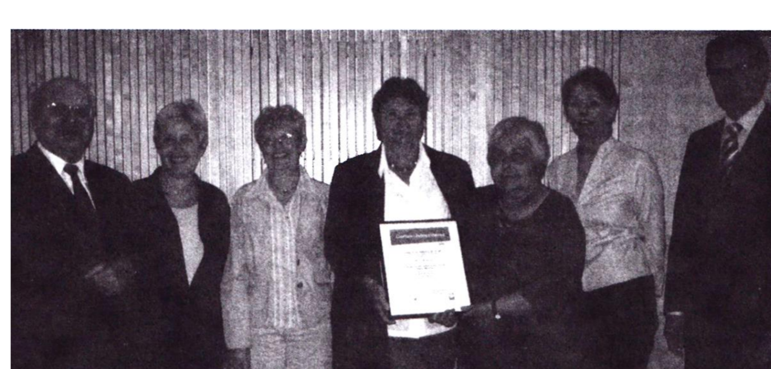
GOA Team, Caritas 1. Preis Integration, Pfarrbrief 2007/8