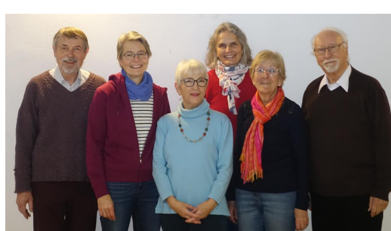
FHM Leitungskreis 2023