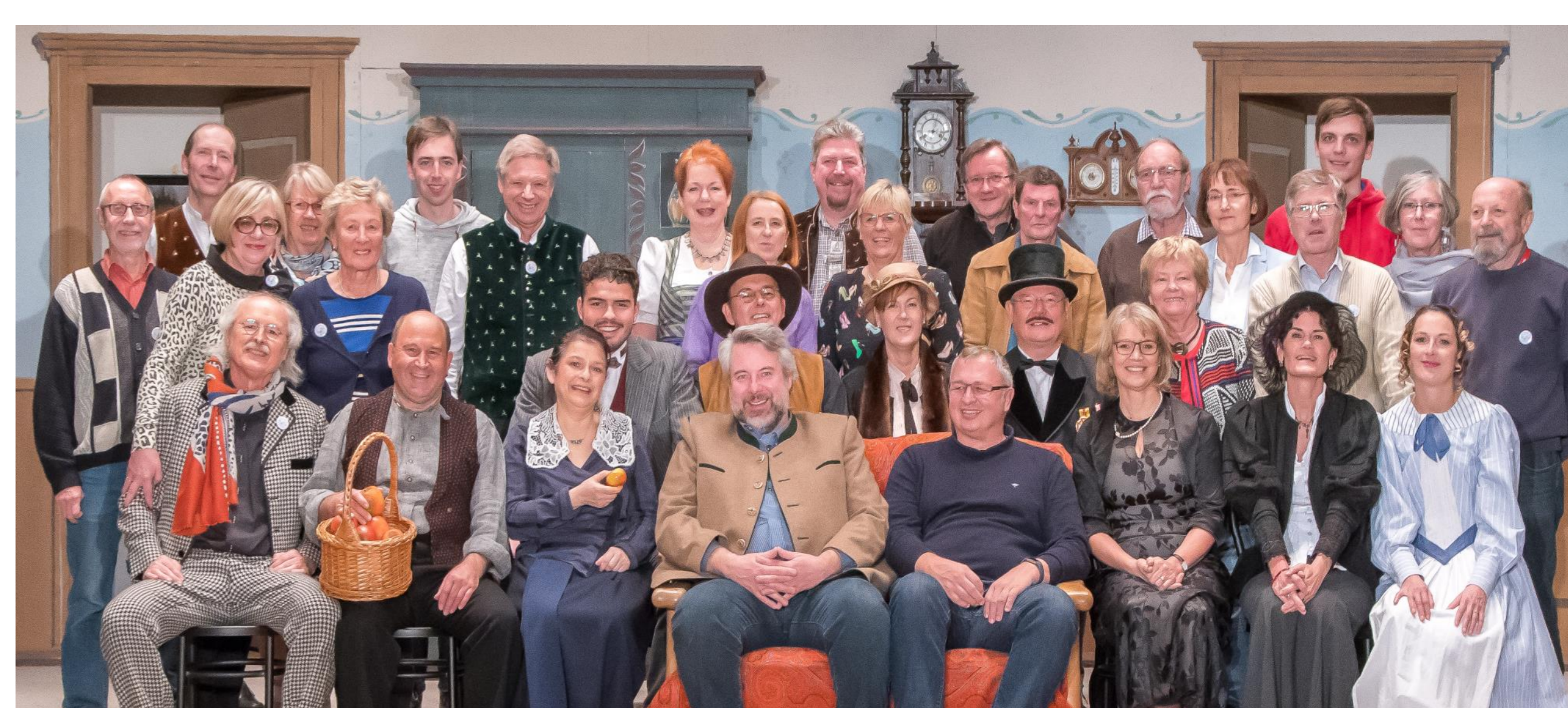
Pension Schaller 2020