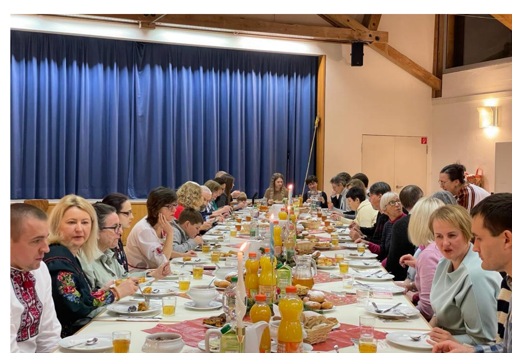
Festlich geschmückter Tisch zum ukrainischen Weihnachten 2023